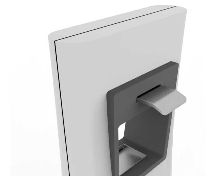
Rendering, Fuge und Hebel