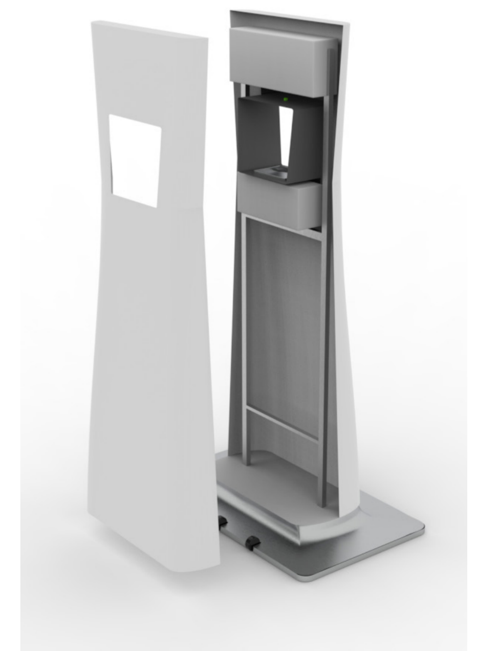
Rendering, Explosionszeichnung - Innenaufbau