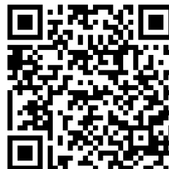
QR-Code zur Rallye

Weitere Fachdatenbanken , die für Ihre Recherche interessant sein können, finden Sie in der DigiBib unter der Rubrik „Datenbanken/Volltexte“ über den Zugang zu Ihrem jeweiligen Fachbereich.