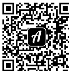
QR-Code zur Rallye

Weitere Fachdatenbanken , die für Ihre Recherche interessant sein können, finden Sie in der DigiBib unter der Rubrik „Datenbanken/Volltexte“ über den Zugang zu Ihrem jeweiligen Fachbereich.